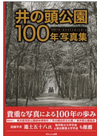
井の頭公園 100年写真集 (ぶんしん出版)