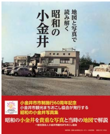
地図と写真で読み解く昭和の小金井 (小金井市観光まちおこし協会)