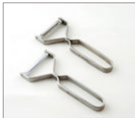
ピーラーと千切りピーラー

ヨシタ手工業デザイン室は、「手で触れ五感に感じることを大切にしたい」「手を動かし道具や素材との対話から気づき着想したい」そういう思いから手工業と名前をつけました。風土や環境と伝統の豊かさに生かされていることを知り、デザインすることで今日の暮らしに少しでも還元したいと思います。